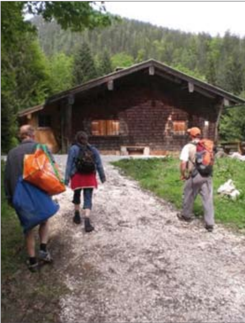
HOHENFRIED. HAUS WEISSBACH.

Nach letzten Check-Up's und dem Beladen der beiden Teamfahrzeuge aus der Hohenfrieder Automobilflotte geht es in zwei Etappen los!