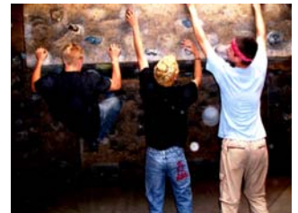
Wie komme ich jetzt hier hoch?

Einige Hohenfrieder haben sich zusammengefunden, um bei dem diesjährigem Radmarathon in Bad Reichenhall am 15. Juni als „ teamHohenfried “ auf das Projekt aufmerksam zu machen. An einem Infopoint ist es möglich sich zu informieren und zu spenden.