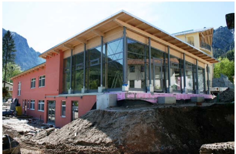
Blick auf das Betriebsrestaurant. Baugrube durch Abriss des alten Müllhauses.

haltenen Wände frei. Zudem wurde das alte Müllhäusl abgerissen.